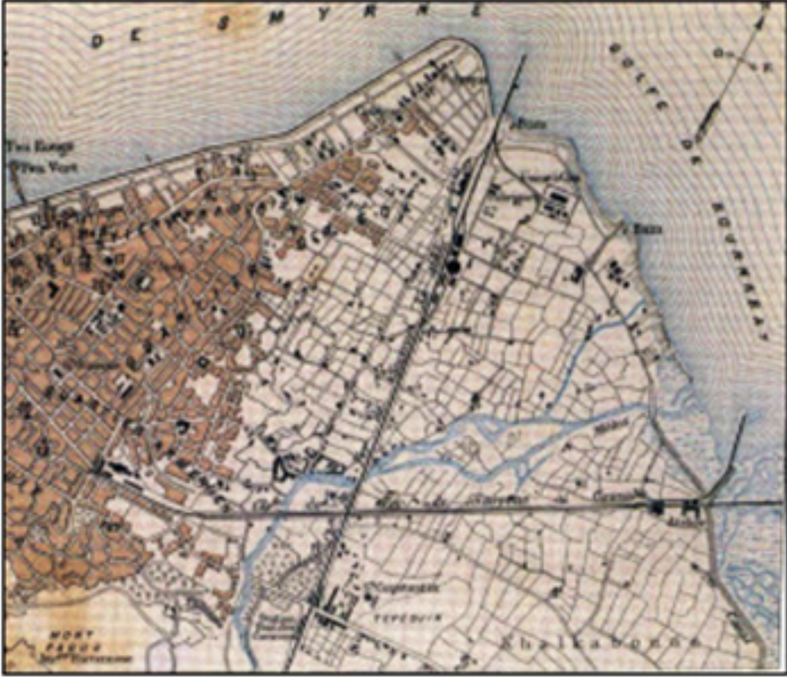
Şekil.1 1885 yılı Luigi Storari Planı (Kaynak. Baykara,2001, s.169; Şimşek,2006, s.89)

1923 Türk-Yunan Nüfus mübadelesi ile Rumların sayıları azalsa da yerine Selanik, Grif ve Makedonya'dan gelen mübadil Türkler yerleştirilerek işçi tedariki sağlamaya devam edilir. Cumhuriyetin ilanından sonra 1055 sayılı Teşvik-i Sanayi Kanunu (1927) ile yabancılara sağlanan imtiyazlar azaltılmış Tren garı, Havagazi fabrikası gibi sanayi yapıları millileştirilmiştir (IZKA, 2014, s. 35).