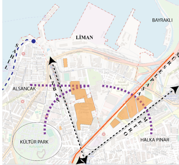
Şekil.5 Kapalı Sitelerin Kültür Park ve Halkapınar ile ilişkisini gösteren harita.

Umurbey/Darağacı'nda sürdürülen bu politika kapalı sitelerin yoğunlaşması ile sonuçlanmış, bölgenin Kültürpark ve Halkapınar ile ilişkisini kesmiş ve şimdiden bölgeyi şehirden hem görsel hem de fiziksel olarak ayırmıştır (Şekil. 5). Kapalı Sitelerin getirdiği yoğunluk ve geçirgenliğinin olmaması hem Umurbey'in çevresi ile hem de kendi iç bağlantılarını yok etmiştir. Bu tarz bir "müteahhit şehirleşmesi" kültürel mirasın bütüncül değerlendirilmesini engellediği gibi her bir tescilli bina çürümeye bırakılıyor ve bu durumun yıkıma sebep teşkil etmesi bekleniyor (Peker, 2023).