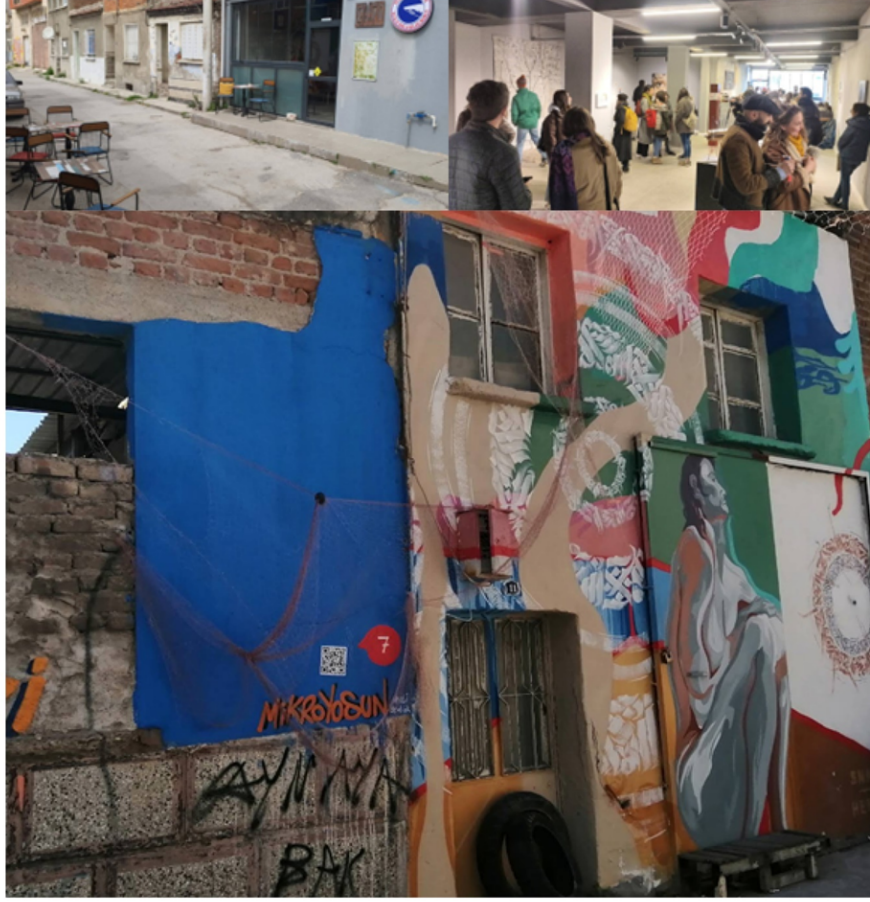
Şekil.4. Üst Sol: Giriş Cephesi (Kaynak. Google Map); Üst Sağ: İçmekandan Görünüş (Google Map); Alt: Darağacı Sokaklarına Sanatın yansımısını gösteren fotoğraf (Kaynak. Yazarlar).