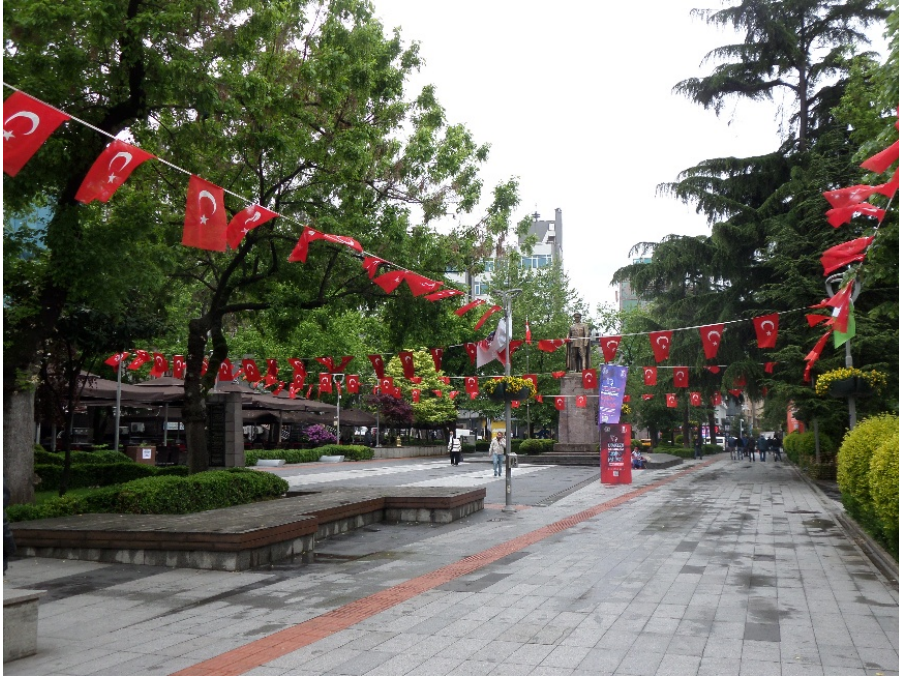
Şekil 6. Atatürk Meydan Parkı (Ufuk Serin, 2025).

Süreklilik gösteren bir diğer kamusal alan ise, batı varoşlarında yer alan, sonradan Kabak/Kavak Meydanı olarak anılan tzykanisterion 'dur. Yalnızca Atina, Konstantinopolis, Efes ve Lakedemon gibi bazı merkezlerde bulunduğu bilinen (Bouras, 2002, 526) tzykanisterion 'un Trabzon'daki varlığı kesin değildir. Ancak, Orta Çağ kaynakları İmparator I. İoannes Komnenos Axouchos'un çugan oynarken düşüp öldüğünü bildirdiği için (Kennedy, 2019, 2-3), araştırmacılar bir oyun sahasının olması gerektiğini varsaymıştır. Finlay (1850, 35-36) bu sahanın yeri için Kavak Meydanı'nı önermiş, Bryer ve Winfield (1985, 202) de bu fikri takip etmiştir. Evliya Çelebi'nin 17. yüzyıldaki ziyaretinde cirit oynandığını bildirdiği Kavak Meydanı (Dağlı ve Kahraman, 2003, 114), 1952-2017 yılları arasında Hüseyin Avni Aker Stadyumu'nun bulunduğu yerdir (Küçük Karakaş ve Gerçek Atalay, 2023). Meydan, stadyumun yıkıldığı 2017 yılına kadar spor alanı olarak süreklilik göstermiştir. Yıkımdan sonra bu alan Hüseyin Avni Aker Millet Bahçesi olarak yeniden düzenlenmiştir.