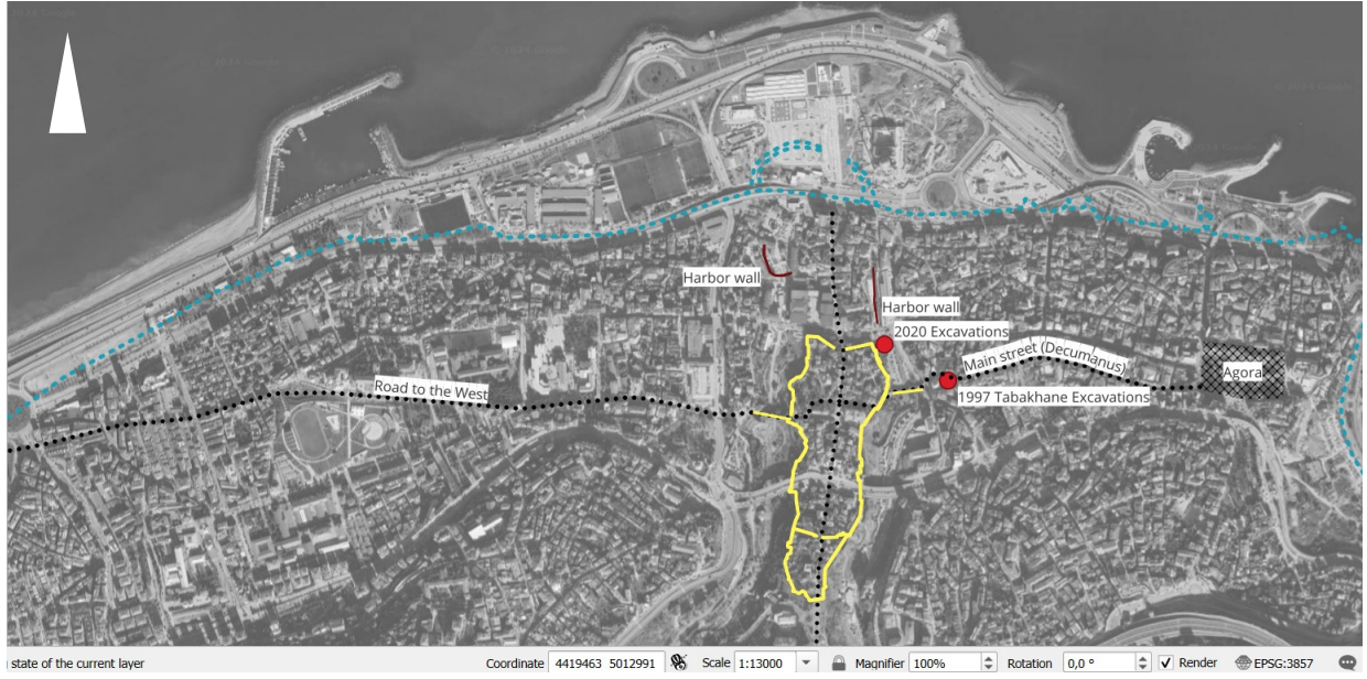
Şekil 2. Antik dönemdeki ana yol aksları ve kurtarma kazılarında elde edilen buluntuların konumları (Selin Sur).