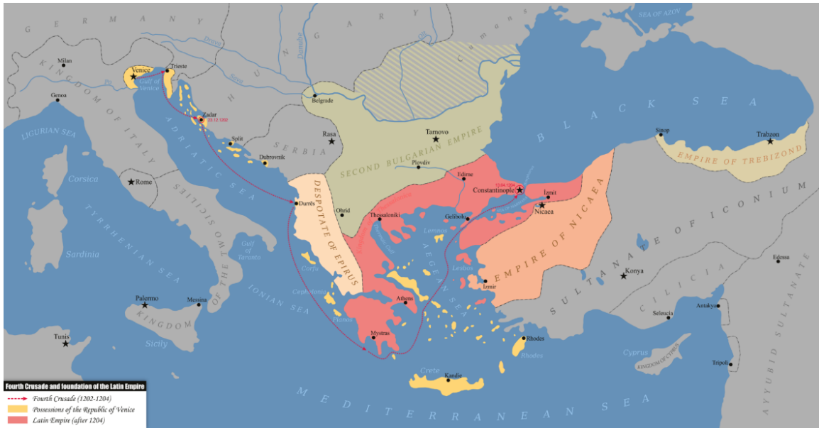
Şekil 1. Bizans İmparatorluğu'nun ardıl devletlerini gösteren harita ( https://en.wikipedia.org/wiki/Empire_of_Trebizond ).

Trabzon'un dikkat çeken özelliklerinden biri, Anadolu'nun en uzun süre kesintisiz yerleşim görmüş kentlerinden biri olarak tanımlanmasıdır (Brandes, 1989, 131). Kentin, sur içi ve sur dışındaki çok merkezli yerleşim yapısının, Antik Çağ'dan bu yana varlığını sürdürdüğü ileri sürülmüştür (Bryer, 1986). Trabzon, Antik dönemde Pontos bölgesinin önemli bir şehriydi. 9. yüzyıldan 11. yüzyıla kadar Bizans İmparatorluğu'nun Chaldia Temasının başkenti olarak hizmet vermiştir (Finlay, 1851, 357). 1204 yılında IV. Haçlı Seferi sonucunda Konstantinopolis'in Latinler tarafından ele geçirilmesinin ardından, Bizans İmparatorluğu parçalanmış ve Epiros Despotluğu, İznik İmparatorluğu ve Trabzon İmparatorluğu ardıl devletleri ortaya çıkmıştır (Haldon, 2005, 118-120) (Şekil.1). Bu süreçte Trabzon, Büyük Komnenos hanedanı tarafından kurulan bağımsız Trabzon İmparatorluğu'nun merkezi haline gelmiştir. Bu imparatorluk, Konstantinopolis 1261'de Paleologoslar tarafından yeniden ele geçirilip Bizans İmparatorluğu ayağa kaldırıldıktan sonra da, 1461 yılında Osmanlı İmparatorluğu tarafından alınmasına kadar bağımsızlığını ve varlığını sürdürmüştür.