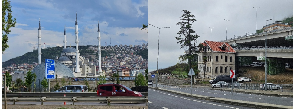
Şekil 10. Hanife Hatun Camii'nin kent silüetine etkisi (Selin Sur, 2025).