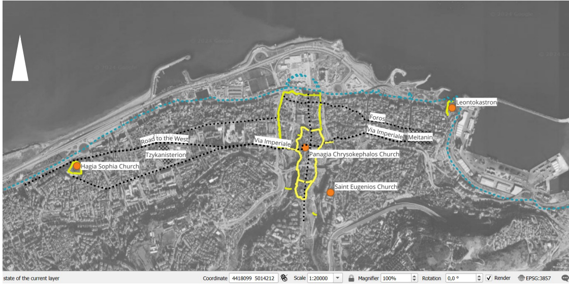
Şekil 5. Geç Orta Çağ'da via imperiale ve diğer önemli yollar (Selin Sur).

Bu dönemde inşa edilen kiliselerin ortak ve belirleyici bir özelliği, merkezi dıştan beşgen apsise sahip olmalarıdır. Çok kenarlı apsiser Bizans kiliselerinde görülmekle birlikte, merkezi beşgen apsis Trabzon'daki kiliselere ait bir özellik olarak tespit edilmiştir (Bryer and Winfield, 1985, 246). Trabzon'da inşa edilen çok sayıda kiliseden yalnızca birkaçı sur içinde yer alırken, çoğu kilise sur dışında, özellikle doğu varoşlarında yer alıyordu. 1 Bu kiliseler odak ve çekim noktası oluşturmuş, mahallelerin gelişimine katkıda bulunmuştur (Üstün Demirkaya ve Tuluk, 2018, 717-719).