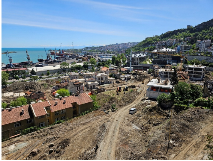
Şekil 12. Çömlekçi Mahallesi kentsel dönüşüm alanı (Selin Sur, 2025).