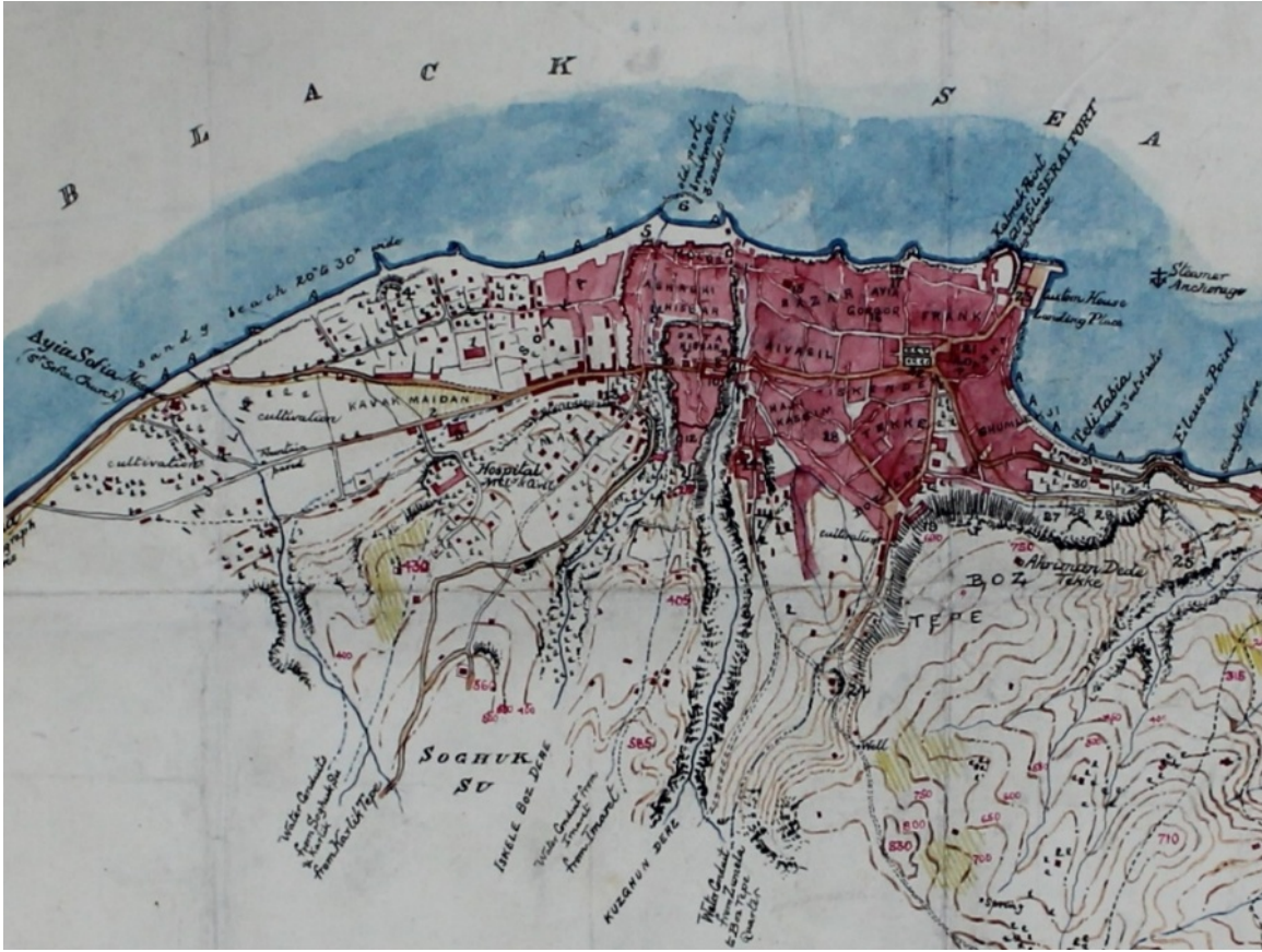
Şekil 7. Maunsell'in Trabzon haritası (1898).