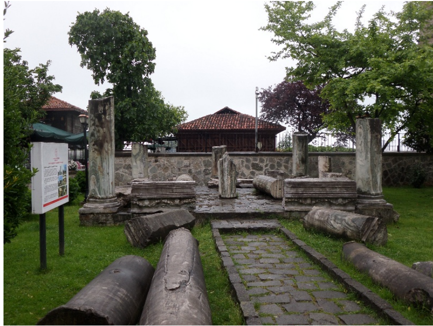
Şekil 3. Ayasofya Camii'nin bahçesinde sergilenen Tabakhane kazısı buluntuları (Ufuk Serin, 2025).

Trabzon Kalesi'nin ilk inşa tarihi kesin olarak bilinmemektedir. Ancak, kentin MS 3. yüzyılda 'barbar' kavimlerin saldırısına uğradığı dönemde, burada iyi korunan bir kalenin varlığı yazılıdır. Bu saldırılarda Borani adı verilen kavmin "tüm tapınakları, evleri ve şehre güzellik katan her şeyi yıktığı, kentin hemen yanındaki taşrayı harap ettiği" belirtilmiştir (Zos. 1.33). Bryer (1986, 266) bu 'taşra'nın, "hiçbir zaman surlarla