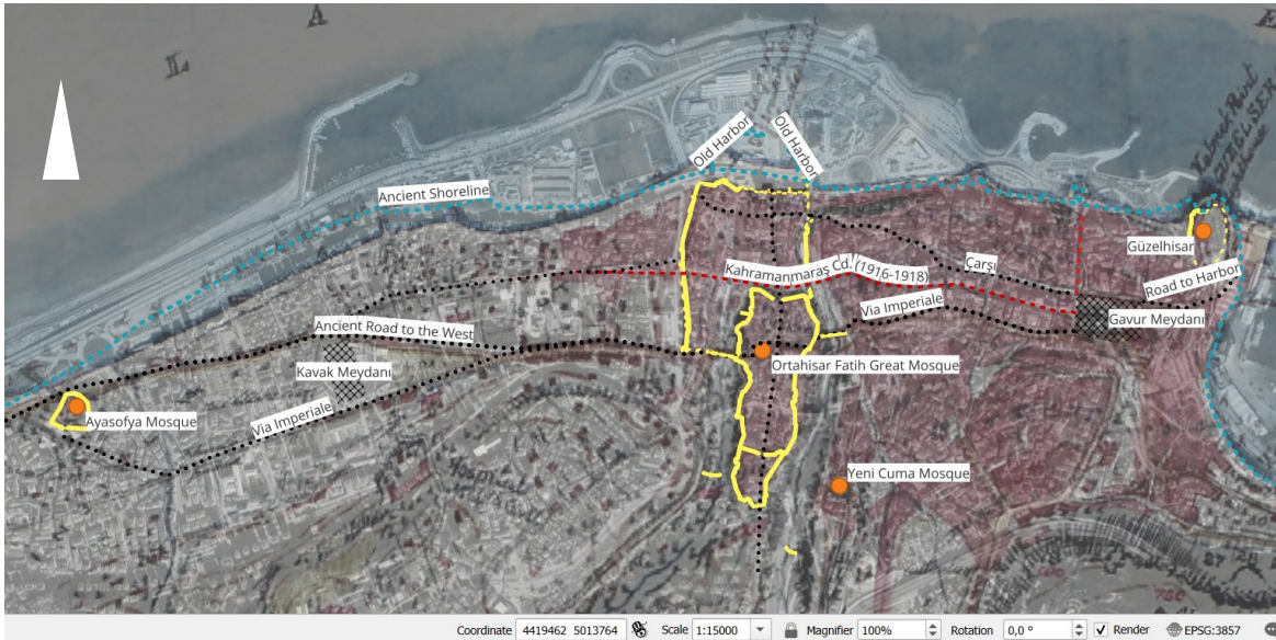
Şekil 8. Kahramanmaraş Caddesi'nin güzergahı (Selin Sur).