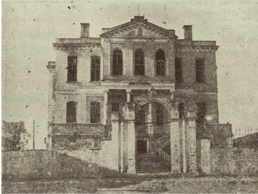
Şekil 1. Bafra Ebrahim Ağa Konağı (Altın Yaprak Bafra Halkevi Dergisi,1936).

İç mekân organizasyonu, merkezde yer alan sofa ve onun etrafına karşılıklı biçimde dizilmiş odalardan oluşmaktadır. Birinci ve ikinci katlarda balkonlar yer almakta; zemin kattaki odalardan ikisinde ise su kuyusu bulunmaktadır.